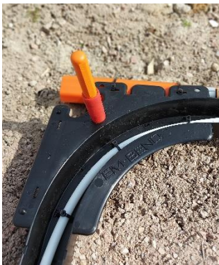
EM-Marker, Frequenz 101,4 kHz (optional bestellbar)