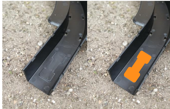
Kennzeichnung für Fittingpositionierung